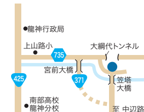
安倍晴明神社 田辺市龍神村殿原