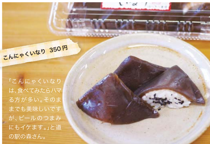
こんにやくいなり 350円

「こんにやくいなりは、食べてみたらハマる方が多い。そのままでも美味しいですが、ピールのつまみにもイケます。」と道の森さん。