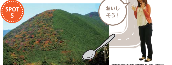
おっぱい山 ロード (P62) 上富田町市ノ瀬