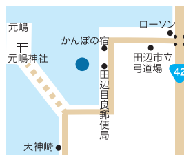
大鳥居 田辺市目良